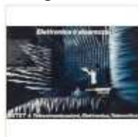
Campagna Stet 1984 - Selenia.jpg