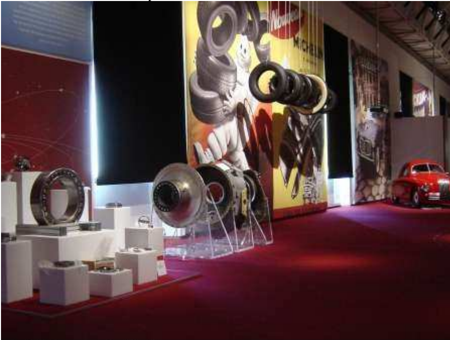
La fabbrica comunica, Rivoli

Foto allestimento di una parte della mostra