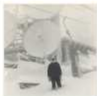
Ponte Radio montano, anni 70.jpg