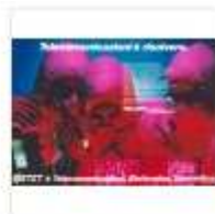
Campagna Stet 1984 - Italdata.jpg