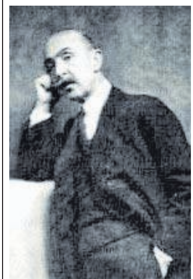
Federico De Roberto